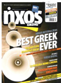
«ήχος Εικόνα» τεύχος Φεβρουαρίου 2014