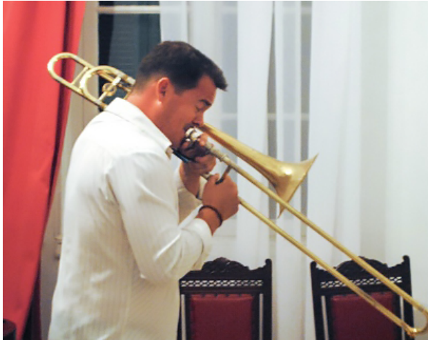
Ο τρομπονίστας Τζέιμι Γουίλιαμς.

Τελευταίο συνάντησα τον εκπληκτικό τσελίστα Ντένις Σεβερίν και απέσπασα μερικές κουβέντες σχετικά με την εμπειρία του στην Ακαδημία: «Καταρχάς, για μένα είναι φανταστικό το ότι γίνεται αυτό το masterclass στην Ελλάδα, μια χώρα με αυτό το πολιτιστικό παρελθόν, έναν από τα σημαντικότερους πολιτισμούς στον κόσμο. Και για την κλασική μουσική είναι εξαιρετικό το ότι συμμετέχουν καλλιτέχνες από ολόκληρο τον κόσμο.