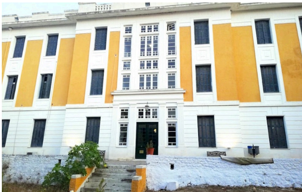
Το δεκαήμερο πρόγραμμα θερινών masterclasses για φοιτητές μουσικής και νέους επαγγελματίες ηλικίας 18-28 σε αυτό το ιδανικό περιβάλλον γιατί αυτό εννοούμε όταν λέμε Ακαδημία Μουσικής έχει πετύχει ήδη να προσελκύσει νέους μουσικούς.

Το δεκαήμερο πρόγραμμα θερινών masterclasses για φοιτητές μουσικής και νέους επαγγελματίες ηλικίας 18-28 σε αυτό το ιδανικό περιβάλλον –γιατί αυτό εννοούμε όταν λέμε Ακαδημία Μουσικής– έχει πετύχει ήδη να προσελκύσει νέους μουσικούς.