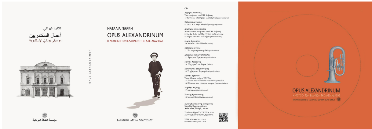
Ναταλία Γεράκη: Opus Alexandrinum, Η μουσική των Ελλήνων της Αλεξάνδρειας, Αθήνα 2024. Σελ. 60, Έκδοση του Ελληνικού Ιδρύματος Πολιτισμού

Στο δεύτερο μέρος η συγγραφέας παραθέτει κείμενα ηχογραφημάτων των συνθετών Σπυριδωνος Παπασταθόπουλου, Παναγιώτη Τσαμπουνάρα, Πέτρου Ιωαννίδη, Μαρίας Σιδεράτου, Δημήτρη Μητρόπουλου, Αργύρη Κουνάδη, Γιάννη Χρήστου, Θόδωρου Αντωνίου, Μιχάλη Ροζάκη, Γιάννη Αυγερινού και Κωστή Κριστάκη. Τα πληροφοριακά αυτά κείμενα για το κάθε επιμέρους ηχογράφημα είναι έργο επίπονο, αλλά που καταμαρτυρεί πόσο σοβαρά είδε τον ρόλο της μια μουσικός, η οποία μας αποκαλύπτει και τη συγγραφική της κλίση. Το βιβλίο όχι μόνο διαβάζεται αλλά εν μέρει ακούγεται, μιας και το συνοδεύει cd με έντεκα έργα Ελλήνων μουσουργών που συνέθεσαν εμπνεόμενοι από την ποίηση του Κ. Π. Καβάφη («Φωνές», «Επέστρεφε», «Μακρυά», «Γκρίζα», «Εν τη Οδώ», «Έτσι πολύ ατένισα», «Μέρες του 1931», «Επήγα») και από δύο τραγούδια του Τ. Σ. Ελιот που τα ερμηνεύουν ο Απόστολος Παληός (πιάνο), η μεσόφωνος Ειρήνη Καράγιαννη (τραγούδι) και η Ναταλία Γεράκη (φλάουτο).